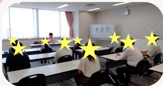
昨年8月の体験会「職場でのメンタルヘルス」の様子