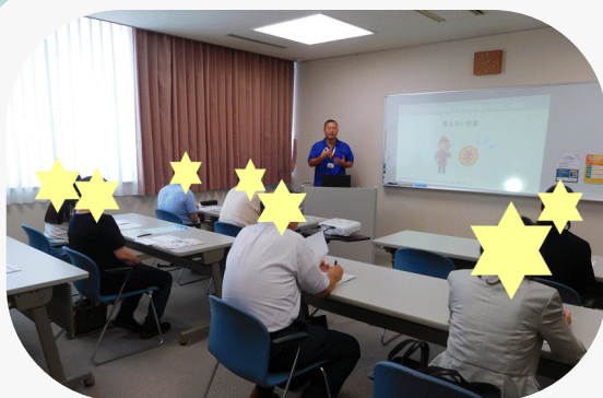
今年8月の体験会「生活習慣の改善」の様子